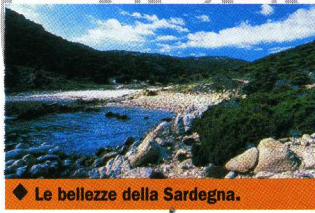
◆ Le bellezze della Sardegna.

Una vacanza dove la realtà supera la fantasia