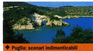
◆ Puglia: scenari indimenticabili