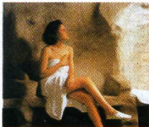
◆ Abano e Montegrotto

Abano e Montegrotto: 2500 anni di salute, bellezza e relax